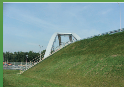
Węzeł „Katowice-Murckowska” na autostradzie A4