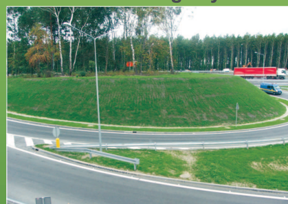
Węzeł „Chorzów-Batory” na autostradzie A4

Wybrane realizacje zazieleniania i ochrony przed erozją obiektów drogowych: