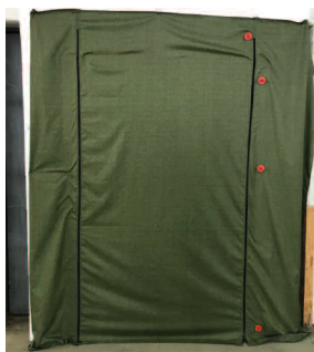
Gotowe prefabrykowane ściany z kształtek szalunkowych Izodom, z drzwiami na zamki błyskawiczne, przekazane do szpitali w Krakowie i Zgierzu

ścian działowych z wykorzystaniem kształtek szalunkowych Izodom, umożliwiający nieprzeszkolonemu personelowi medycznemu samodzielne wykonanie grodzi i 24 marca br. bezpłatnie dostarczył 10 ścian do Szpitala Uniwersyteckiego Jagiellońskiego w Krakowie i do Szpitala w Zgierzu. Opracowane i wykonane rozwiązanie, to ścianka z dociętych kształtek szalunkowych Izodom doklejana do sufitu i podłogi pianą montażową. Drzwi dla personelu o szerokości 0,9 m