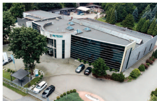
Obiekt biurowo-produkcyjny Grupy PETECKI w Łodzi

Grupa PETECKI została założona w 1995 r., a obecnie jest jednym z czołowych w Polsce producentów stolarki otworowej oraz ślusarki aluminiowej. Tworzą ją trzy niezależne spółki. Grupa ma obecnie cztery fabryki, co pozwala jej efektywnie zarządzać procesem produkcji i adaptować się do zmieniających się potrzeb rynku.