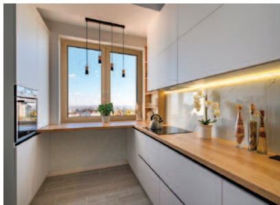
Okno serii Excellent Style NEO 76 MD

System umożliwia stosowanie pakietów szybowych oraz wypełnień o szerokości do 54 mm. Dodatkowo wyposażony jest w specjalną ekstrudowaną przylgę środkową w wersji MD, która pełni