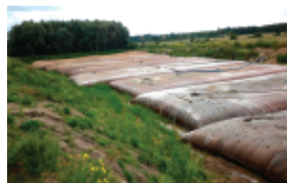
Fot. 4. Georury umieszczone w zagłębieniu przygotowane do zasypania terenu

Kolejną interesującą realizacją, gdzie wykorzystano rękawy geosyntetyczne, było pogłębienie doku pływającego w porcie miasta Kłajpeda na Litwie , w celu umożliwienia wpływania większych jednostek pływających. Wydobywane osady transportowano na prawie 2 km od miejsca poboru. Rękawy układano podwójnie, jeden na drugim i obok siebie, by ograniczyć teren, co