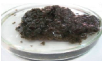
Fot. 2. Wytracenie fazy wodnej z osadu po dodaniu polielektrolitu

oddziaływań, jakie zachodzą pomiędzy ładunkami. W związku z tym właściwości flokulantów są bardzo złożone. Biorąc pod uwagę charakter grup jonowych, mamy do czynienia z polielektrolitami anionowymi i polielektrolitami kationowymi zbudowanymi odpowiednio z makrocząsteczek naładowanych ujemnie lub dodatnio, posiadającymi równoważną ilość przeciwnów. Są również poliamfolity, które mają makrocząsteczki zarówno grup anionowych, jak i kationowych, lub też inne grupy jonizacyjne. Wyróżnia się także flokulanty silne bądź słabe, co wynika ze zdysocjowania w zakresie pH [2].