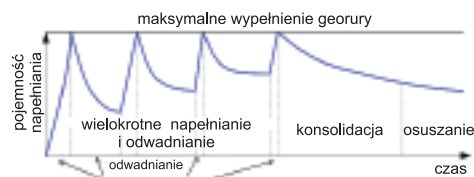
Rys. 2. Schematyczny przebieg odwadniania osadu

ich osuszeniu otrzymujemy znaczną redukcję materiału. Można go wydobyc przez rozcięcie rękawa geosyntetycznego, a następnie przewieźć w docelowe miejsce składowania. Istnieje także możliwość zasypiania georury, a teren można zazielenić bądź wykorzystać do innych celów. Takie rozwiązanie jest możliwe tylko wówczas, gdy szlamy pochodzące ze zbiornika wodnego nie zagrażają środowisku, a więc nie zawierają substancji toksycznych, a parametry nie przekraczają wyznaczonych norm.