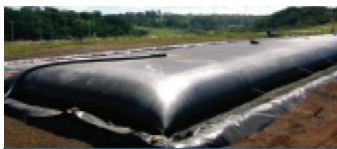
Fot. 1. Napelniona georura na polu drenażowym

N owoczesna technologia georur SoilTain® służy do odwadniania osadów dennych, pochodzących z różnego rodzaju zbiorników i cieków wodnych, a nawet osadów morskich. Georury (fotografia 1) wykonuje się z materiału geosyntetycznego, najczęściej geotkanin poliestrowych i polipropylenowych, które są specjalnie zszywane, tworząc syntetyczny rękaw z kominem. Materiał geosyntetyczny ma dużą wytrzymałość i wodoprzepuszczalność. Dzięki odpowiedniej wielkości porów ciecz wypływa na zewnątrz georury, a części stałe pozostają w jej wnętrzu [1]. Ze względu na różną wielkość